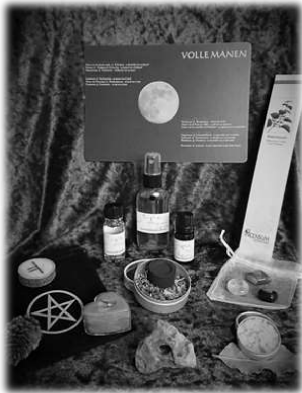
Als onderdeel op de Moon Challenge